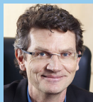
D. Céna 4